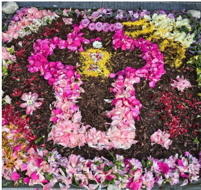
Blumentepich vor dem Kinderhaus Andreas (Statio bei der Fronleichnamsprozession)