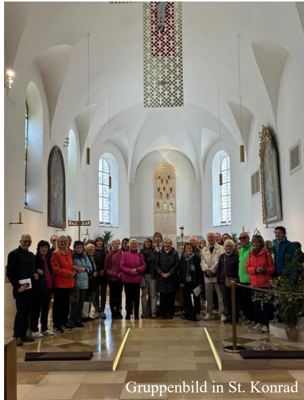
Gruppenbild in St. Konrad