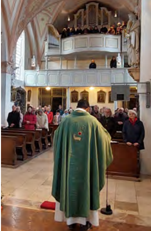
Rosenmontagsgottesdienst mit dem Holzhackerverein zum 175-jährigen Bestehen