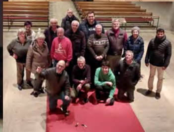
Team vom Aufstellen der Weihnachtsbäume